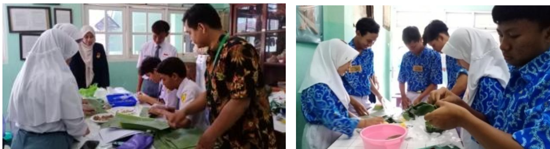
Gambar 2. Pelaksanaan Proyek di Kelas Eskperimen I (Kiri) dan Kelas Eksperimen II (Kanan)

Berdasarkan uji t 2 pihak ( uji independent sample t test ) menunjukkan bahwa ada perbedaan penguasaan konsep bioteknologi siswa kelas eksperimen I dan eksperimen II, sehingga H_0 ditolak dan H_1 diterima. Perbedaan tersebut disebabkan karena produk inovasi tempe memiliki tingkat produksi dan keberhasilan produk jadinya yang lebih rumit dibandingkan produk inovasi tapai. Implementasi pembelajaran dengan model PjBL dapat membantu siswa dalam menyelesaikan permasalahan. Kelas eksperimen II lebih mandiri dan berinisiatif lebih tinggi dalam membangun pengetahuannya sendiri melalui studi literatur, merefleksikan proyek, dan belajar dari hasil presentasi di kelas. Selain itu, kelas eksperimen I kurang kondusif untuk pelaksanaan pembelajaran dan proyek. Kegiatan proyek dapat meningkatkan penguasaan konsep siswa karena siswa telah mengalami kegiatan tersebut (Lestari, 2018). Hasil penelitian ini didukung oleh Prakasa (2022) yang menunjukkan bahwa risetnya menunjukkan model PjBL dapat meningkatkan pemahaman siswa yang ditinjau berdasarkan hasil belajar siswa kelas X di SMK Rajasa Surabaya pada mata pelajaran pekerjaan dasar.