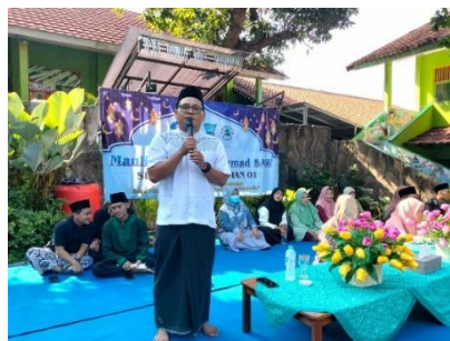
Gambar 6. Kegiatan Keagamaan

Berdasarkan hasil wawancara, observasi dan dokumentasi pada pelaksanaan Strategi Kepala Sekolah dalam mengoptimalkan peran serta orangtua, ditemukan bahwa peran serta orangtua terhadap sekolah sudah berlangsung dengan sangat baik. Hal tersebut dibuktikan dengan adanya komunikasi yang terbuka, keterlibatan orangtua di setiap kegiatan yang begitu beraneka. Mulai kegiatan akademik, keagamaan, kesehatan, parenting, ekstrakurikuler dan lain sebagainya. Semua terlaksana dan orangtua ikut terlibat di dalamnya. Pengadministrasian juga berjalan rapi, adanya daftar hadir dan buku notula termasuk dokumentasi foto-foto di setiap kegiatan sekolah.