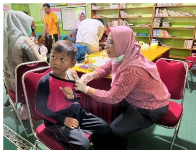
Gambar 5. Pemberian Imunisasi Melibatkan Orangtua