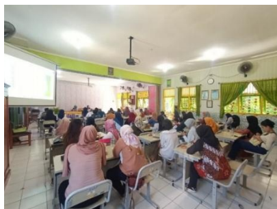
Gambar 2. Rapat Orangtua

Strategi kepala sekolah dalam mengoptimalkan peran serta orangtua sehingga dapat meningkatkan kualitas sekolah dibuktikan dengan adanya dokumen-dokumen yang memperkuat tindakan tersebut. Antara lain dokumen visi misi sekolah, dokumen penanda tangan sekolah ramah anak, dokumen daftar hadir rapat beserta notulannya, dokumen pada ceklis wawancara, baik wawancara terhadap kepala sekolah, guru, maupun orangtua, dokumen keterlibatan orangtua dalam kepanitiaan di setiap kegiatan, berupa SK dan susunan kepanitiaan, juga dokumentasi berupa foto-foto kegiatan (Gambar 2- Gambar 6).