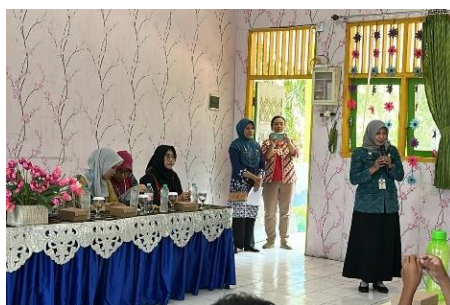
Gambar 3. Parenting Class