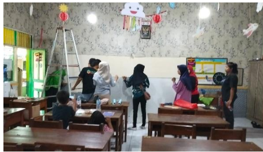
Gambar 4. Kerja Bakti Kelas