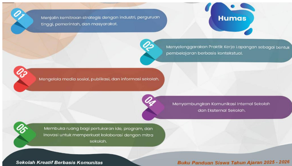
Gambar 1. Program Kerja Humas

Dikutip dalam Buku Panduan Siswa tahun ajaran 2025-2026 manajemen humas dalam sekolah SMK IPIEMS Surabaya mempunyai lima program kerja yang setiap tahunnya dijalankan. Salah satunya terdapat program kerja menjalankan kemitraan strategis dengan industri, perguruan tinggi, pemerintah, dan Masyarakat. Program kerja tersebut sangat diprioritaskan oleh humas SMK IPIEMS, mereka menjalin kemitraan dengan sembilan puluh delapan mitra yang saling menguntungkan.