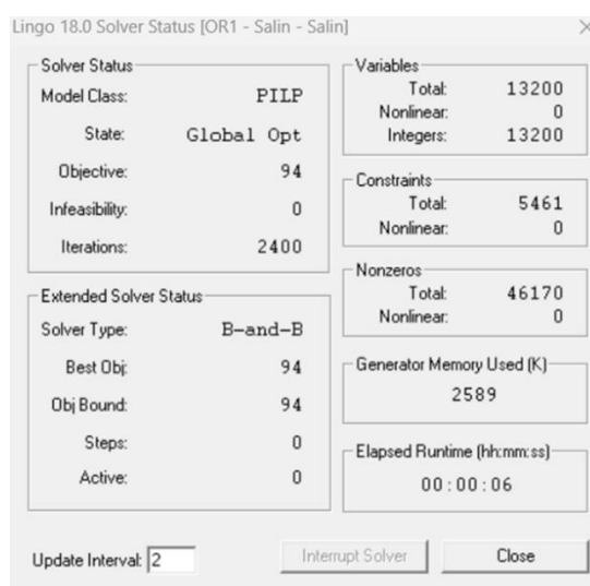
Gambar 2. Status pencarian solusi

dijadwalkan pada waktu dan/atau ruangan yang sama. Sebagai contoh, pada hari Selasa pukul 10.00-10.50 terdapat kelas Pengadaan dan Kontrak Proyek Migas (1 SKS) untuk angkatan 2020 (Semester 7) yang diselenggarakan di ruang kelas 2701. Selanjutnya mahasiswa yang menggunakan kelas tersebut adalah mahasiswa Semester 5 (angkatan 2021) dengan mata kuliah Pemodelan dan Simulasi Sistem Logistik (2 SKS) pada pukul 15.30 s.d. 17.10 WIB. Contoh tersebut membuktikan bahwa setiap kelas di Program Studi Teknik Logistik Universitas Pertamina yang dijadwalkan untuk Angkatan 2023, 2022, 2021, 2020, tidak tumpang tindih serta diketahui bahwa semua perkuliahan mendapatkan alokasi waktu dan ruangnya masing-masing.